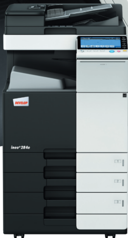
ineo+ 284e con mobiletto con cassetto da 500 fogli (PC-110) e alimentatore originali Dual scan (DF-701)