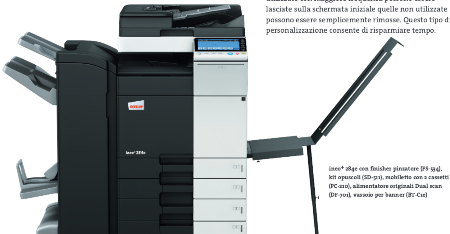
ineo+ 284e con finisher pinzatore (FS-534), kit opuscoli (SD-511), mobiletto con 2 cassette (PC-210), alimentatore originali Dual scan (DF-701), vassoio per banner (BT-C1e)

Molti sistemi multifunzione per ufficio sono complessi da utilizzare. ineo+ 224e/284e/364e, viceversa, è semplicissima. Un concetto di funzionamento semplice e intuitivo assicura una facilità d'utilizzo analoga a quella di uno smartphone o di un tablet. Il touchscreen capacitivo da 9 pollici è dotato di funzioni note come flick&drag e grazie a una nuova struttura di navigazione del menu è possibile visualizzare tutte le funzioni contemporaneamente e selezionare le impostazioni desiderate con pochi clic. Le funzioni utilizzate con maggiore frequenza possono essere lasciate sulla schermata iniziale quelle non utilizzate possono essere semplicemente rimosse. Questo tipo di personalizzazione consente di risparmiare tempo.